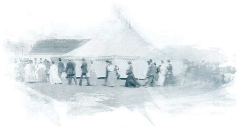
Asambleja e Përgjithshme, Pilot Point, Teksas (USA), 13 Tetor 1908.

Në vitin 1919, Asambleja e pestë e Përgjithshme e ndryshoi emrin e emërtesës, në, Kisha e Nazaretasit. Emri "pentakostal" nuk kishte më kuptimin e fjalës "doktrina e shenjtërisë" siç njihej në fundin e shekullit të 19-të. Emërtesa e re i qëndroi besnike misionit të saj fillestar, të predikimit të ungjillit të shpëtimit të plotë.